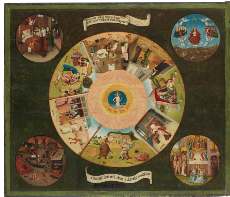
Mesa de los pecados capitales. ElBosco. Óleo sobre madera de chopo. Año 1500.

En cuanto ciencia de la belleza, la Estética se ocupará de lo bello, pero también se preguntará sobre lo feo. Si analizamos los cuadros renacentistas como, por ejemplo, La Primavera del pintor renacentista Sandro Boticelli podremos observar la idea de equilibrio, perfección, un cuidado manejo de las líneas, los colores, lo que deviene en un fenómeno bello. Lo feo, por lo contrario, será lo opuesto a la belleza, algo desordenado, un objeto que está desfigurado en la forma, se observarán el caos de los elementos. Lo feo provocará repulsión en el sujeto que lo observa. Por otra parte, podemos analizar la belleza de la fealdad. Si pensamos en los cuadros del pintor flamenco del siglo XVI Hieronymus Bosch, llamado el Bosco, observaremos figuras macabras de ciencia ficción, figuras antropomorfas. El Bosco plantea su obra de arte desde la culpabilidad del pecado. El hecho pecaminoso debe ser juzgado y castigado. Un ejemplo paradigmático de esto es el cuadro Mesa de los siete pecados capitales . En sus cuadros el Bosco plantea personajes tétricos y oscuros en contraste con algunos puros y resplandecientes. Un paralelo en la música es Carlo Gesualdo, príncipe de Venosa y conde de Conza, figura musical interesante como particular del siglo XVI-XVII. Así como el Bosco en la pintura, Gesualdo sale de las normativas de su tiempo planteando temáticas oscuras. En sus seis libros de madrigales, especialmente